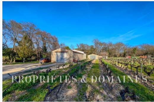
PROPRIÉTÉS & DOMAINES