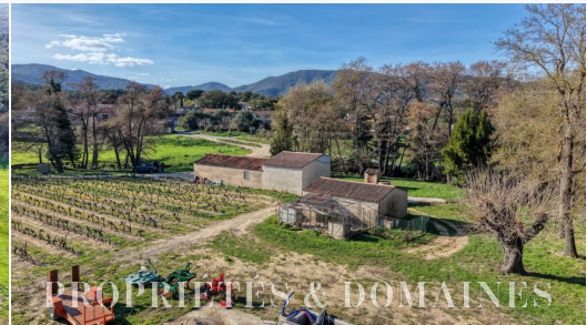
PROPRIÉTÉS & DOMAINES