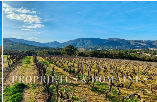
PROPRIÉTÉS & DOMAINES