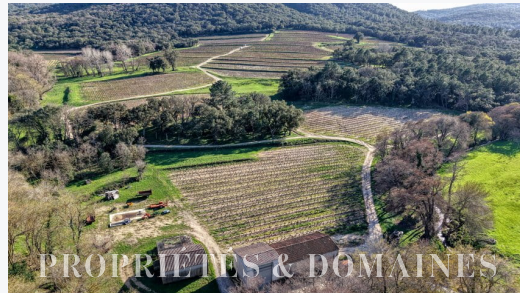
PROPRIÉTÉS & DOMAINES