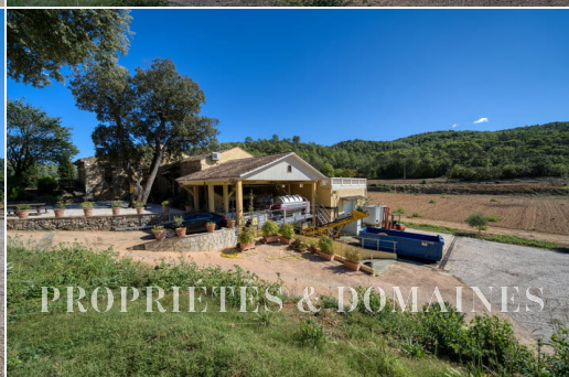
PROPRIÉTÉS & DOMAINES