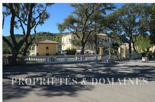
PROPRIÉTÉS & DOMAINES