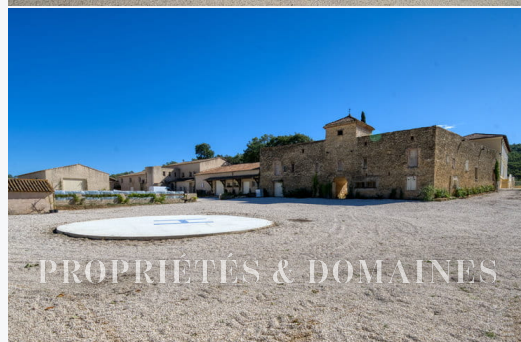
PROPRIÉTÉS & DOMAINES