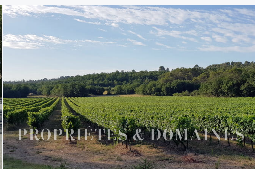
PROPRIÉTÉS & DOMAINES