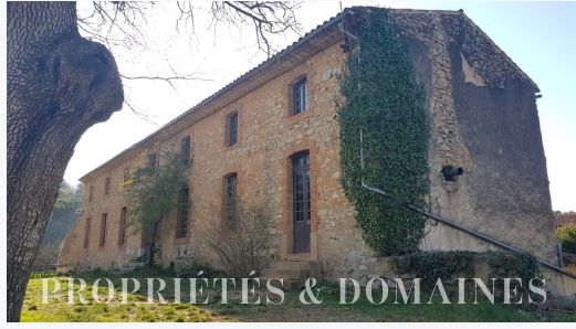
PROPRIÉTÉS & DOMAINES