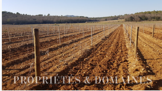
PROPRIÉTÉS & DOMAINES