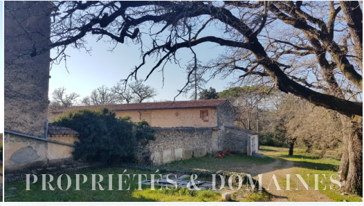
PROPRIÉTÉS & DOMAINES